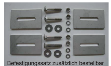
Befestigungssatz zusätzlich bestellbar